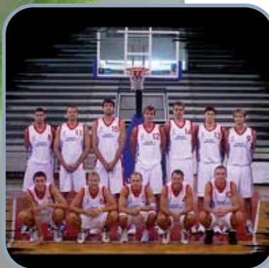
ČESKÁ BASKETBALOVÁ REPREZENTACE

Zavedení stretchového vlákna po celé ploše ponožky zajišťuje ideální držení úpletu na noze a nevytváří nežádoucí přehyby materiálu v obuvi.